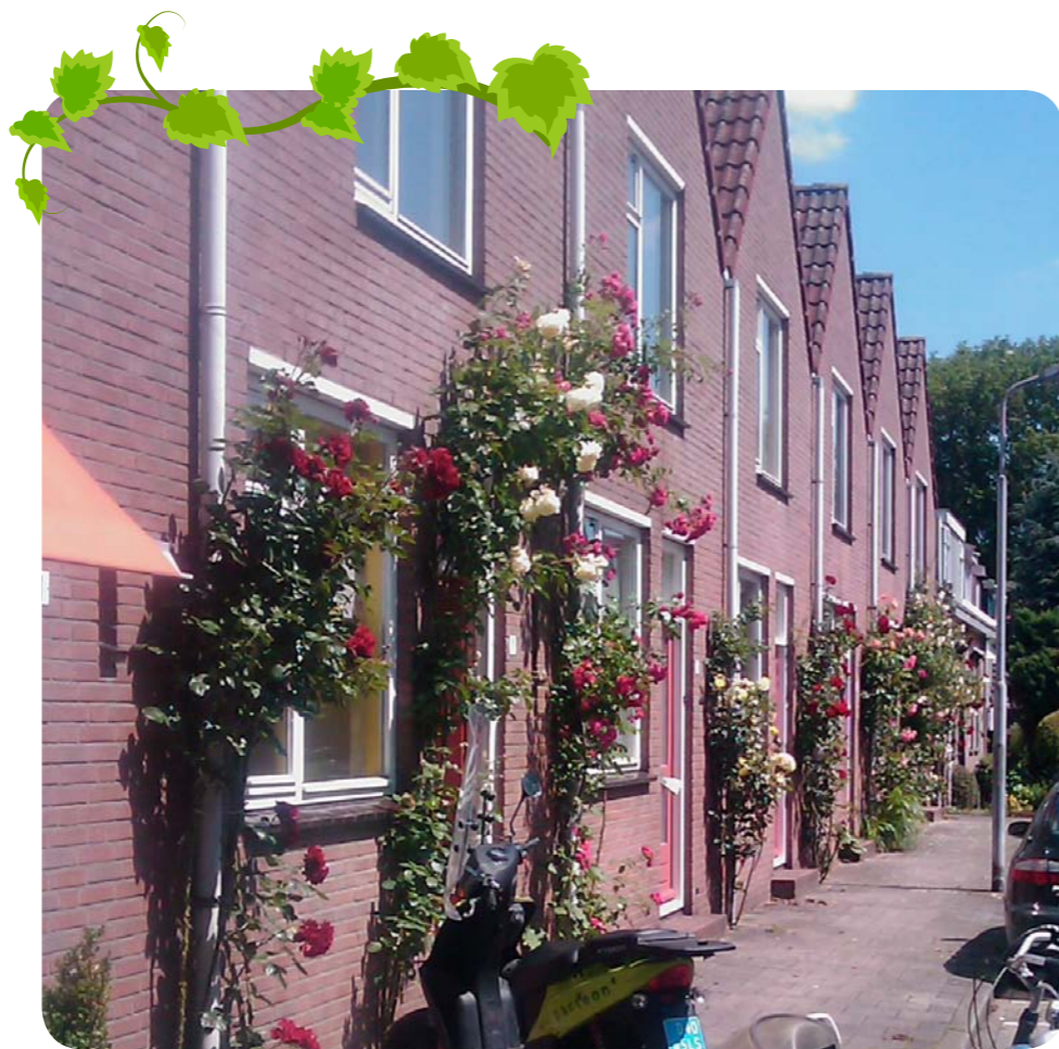
Het Konijnenpad in de Rosmolenwijk in Zaandam is een oase van rozen. Deze rozen zijn geplant door een bewoner, die ze ook onderhoudt. De straat wordt door veel mensen 'het rozenpad' genoemd.

In de zomer trekken we er massaal op uit: lekker fietsen, wandelen en genieten op een zonovergoten terras. Of we blijven thuis, in de tuin of op het balkon. Dat blijkt ook uit uw vele reacties op onze oproep voor foto's van mooie, eigen buitenplekjes. Op deze pagina een inspirerende selectie én een aantal slimme buitentips!