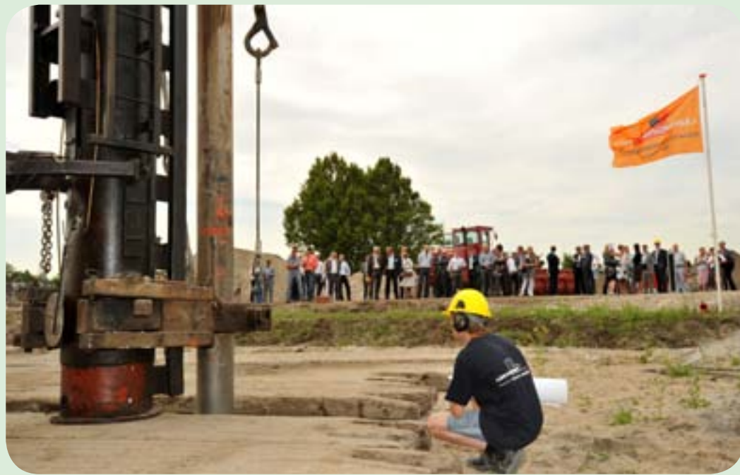
In Wormerveer is het startsein gegeven voor het project Rietvelden Noord. Hier komen, naast de koop- en zorgappartementen, maar liefst 58 huurwoningen.

Parteon heeft op 29 juni het startsein gegeven voor de bouw van maar liefst vijf nieuwbouwprojecten. Een unieke gebeurtenis. Het gaat om het project: Rietvelden in Wormerveer en vier projecten in Zaandam: Plan Jedeloo, Poort van Rustenburg (Inverdan), Koning Davidstraat en Luikse Hoven.