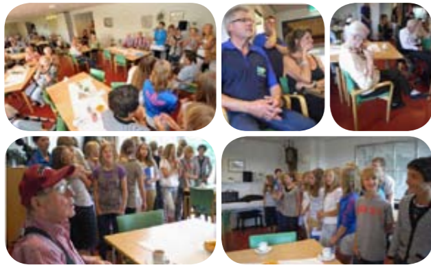
Er werd geklapt en gelachen bij de uitvoering. Sommigen hadden zelfs tranen in hun ogen...

Onze wijktoezichthouders hebben met groep 8 van basisschool De Kroosduikers op donderdag 7 juli 2011 een uitvoering gegeven voor de bewoners van woonzorgcentrum Lambert Melisz. Zij zongen liedjes uit de musical 'Voor Kids gaat de zon op', een idee van War Child, dat zich inzet voor kinderen in oorlogsgebieden. De uitvoering stond in het teken van gezelligheid én het bij elkaar brengen van jongeren en ouderen. De bewoners genoten volop, onder het genot van een hapje en een drankje. Er werd geklapt, gelachen en sommigen hadden zelfs tranen in hun ogen... En alle vrijwilligers en kinderen van groep 8? Zij deden het fantastisch!