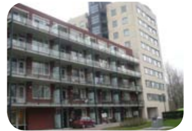
Seniorenwoningen, Eglantier in Krommenie

Om in aanmerking te komen voor een zorgwoning, heeft u een indicatie nodig. Meer informatie hierover vindt u bij het WMO-loket van de gemeente Zaanstad ( www.zaanstad.nl ).