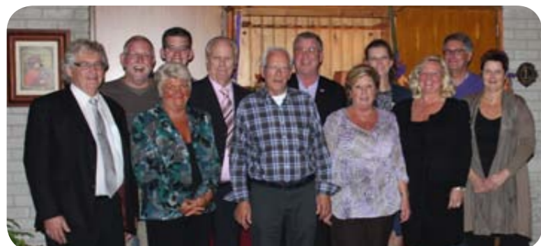
Het nieuwe bestuur van de Bewonersraad na de ledenwerfactie

De (onafhankelijke) bewonersraad behartigt de belangen van de huurders van Parteon. De Bewonersraad praat met de directie van Parteon over beleidsmatige zaken die alle huurders aangaan zoals het woonbeleid voor jongeren en senioren en de jaarlijkse huurverhoging.