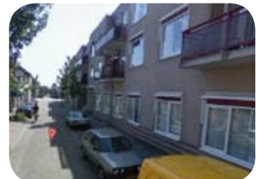
Zorgwoningen, Warmoesstraat in Wormerveer