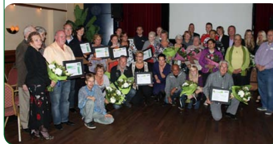
Prijswinnaars Servicegelden 2011

Zonnehuis – Meerdaagse evenementen voor de jeugd (volledig gesponsord), 1650 euro